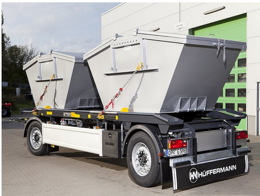
Kombinált rakományrögzítés Zentrier-Fix rendszerrel és kötözőláncokkal