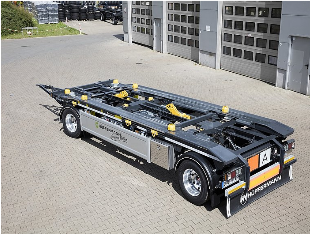
Különleges kivitel WELAKI konténerekhez