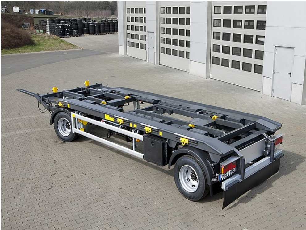
OPCIÓ: Multi-Fix lánc nélküli rakományrögzítés elegance edition kivittel